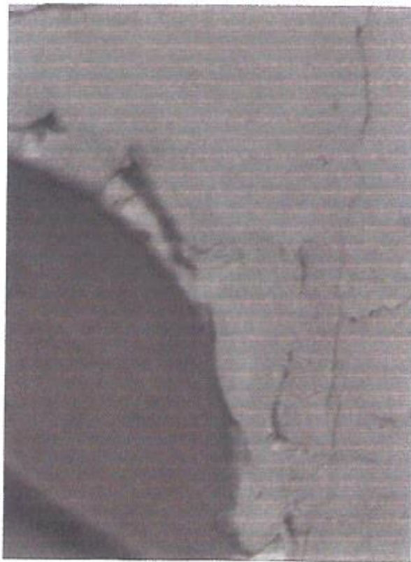
Zniszczenia struktury drewna i powłok malarskich na szafie .