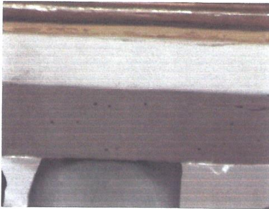
Zniszczenia struktury drewna i powłok malarskich na szafie .