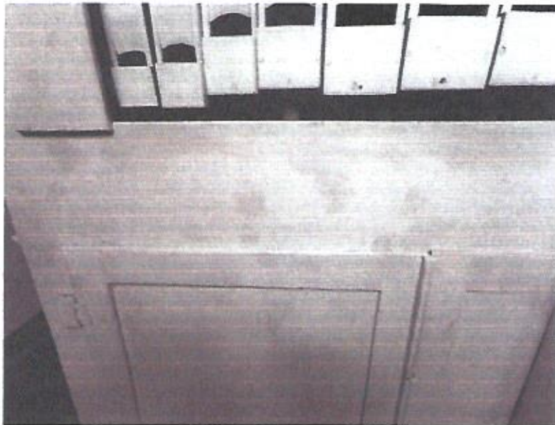
Zniszczenia powłok malarskich na szafie, widoczne odbarwienia interwencji malarskich .