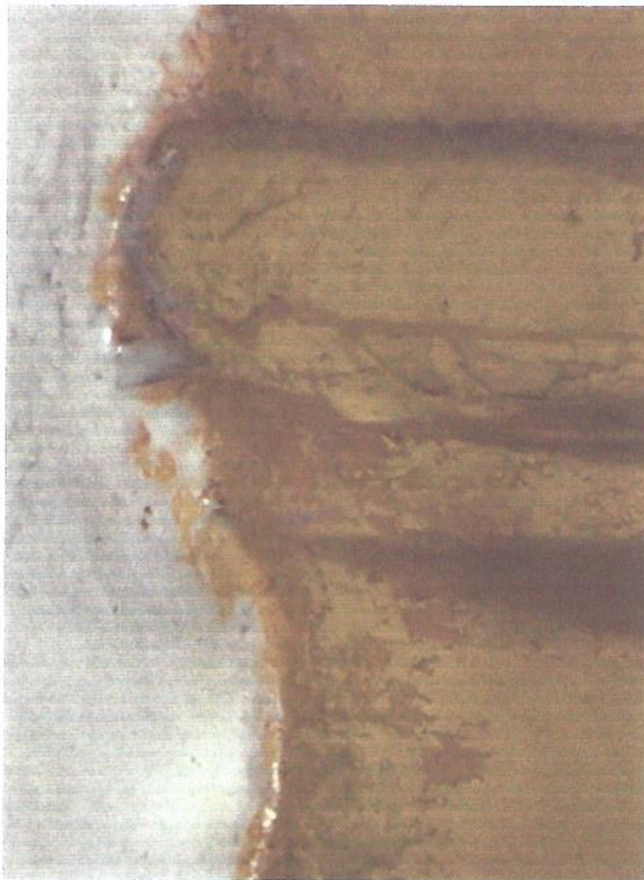
Prospekt organowy. Dekoracja pozłotnicza.