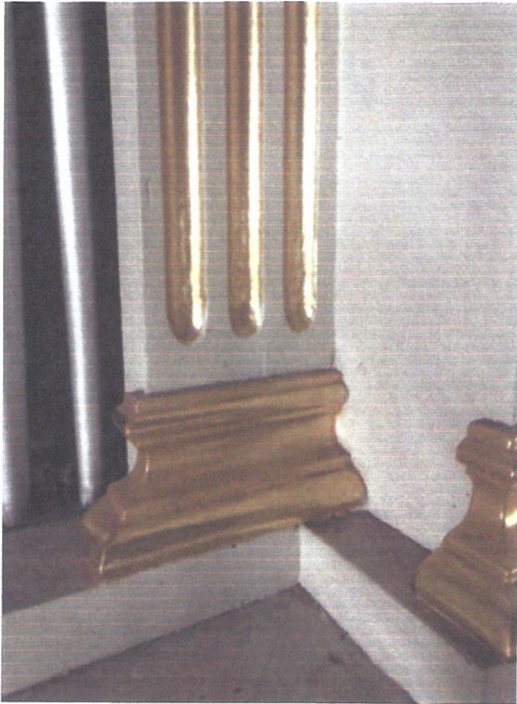
Prospekt organowy. Dekoracja pozłotnicza.